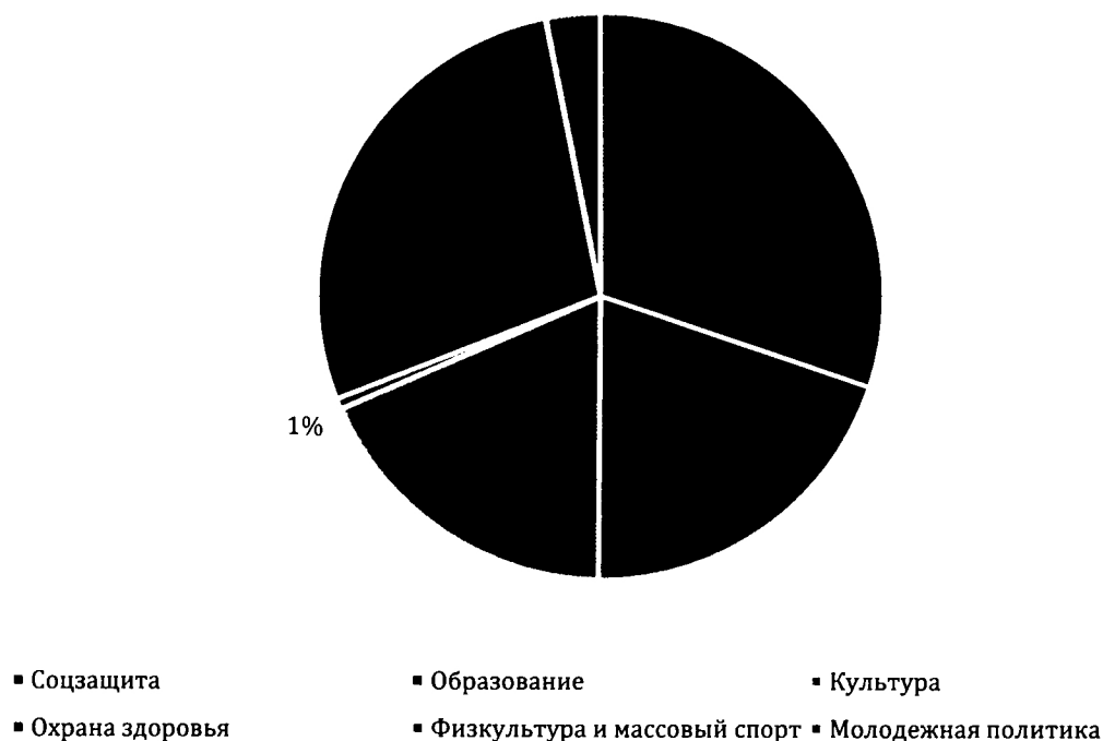
Рисунок 1. Общий объем средств бюджетов субъектов Российской Федерации, фактически переданных СОНКО на оказание услуг по отраслям, %